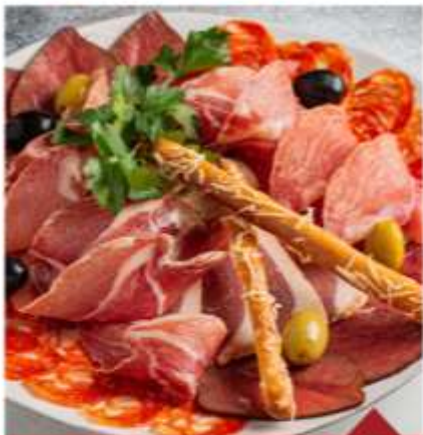
МЯСНАЯ ПАЛЛЕТА | 2900₽ MEAT PLATE 435 гр

Пармская ветчина, утиная грудка, брезаола, чоризо, говяжий язык, трюffel, каперсы, маслины / olives Pork ham, duck breast, bresaola, chorizo, beef tongue