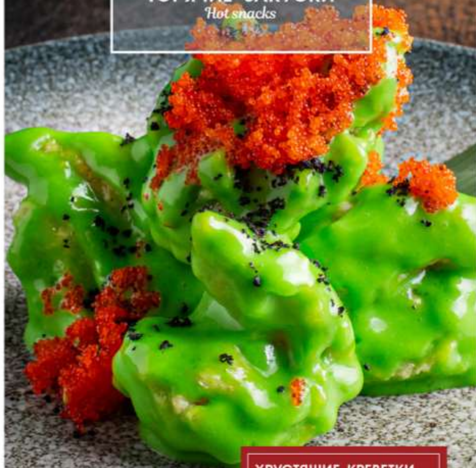
ХРУСТЯЩИЕ КРЕВЕТКИ В СОУСЕ ВАСАБИ 200 гр CRISPY PRAWNS IN WASABI SAUCE 1230 ₽