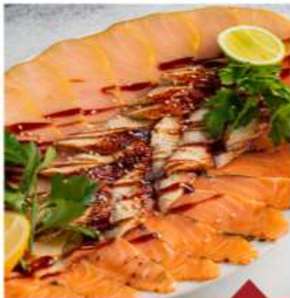
РЫБНОЕ АССОРТИ | 3350₽ FISH PLATE 470 гр

Пармская ветчина, утиная грудка, брезаола, чоризо, говяжий язык, трюffel, каперсы, маслины / olives Pork ham, duck breast, bresaola, chorizo, beef tongue